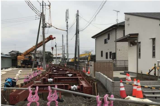
構造物際での施工

GEOTETS工法は、土留め部材を引き抜くことで生じる地中の空隙に専用の恒久グラウト材を同時充填させ、土留め部材を固化したグラウト材に置き換える工法である。軟弱地盤や重要構造物に近接した箇所でも安心して引き抜き、長期にわたり地盤沈下などを抑制する。