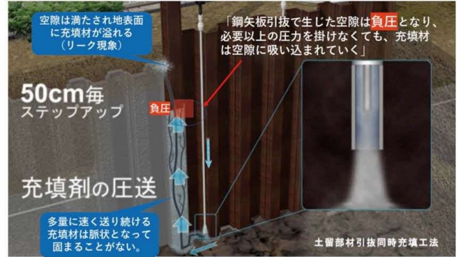
GEOTETS (ジオテツ) 工法