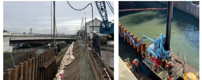
ため池・河川堤防での施工

近年は、大雨による大災害が頻発していることもあり、河川・ため池堤防における土留め工事において、水みちを作らないオンリーワン対策工法として使用実績が増えている。また、水中での施工も可能な方法である。